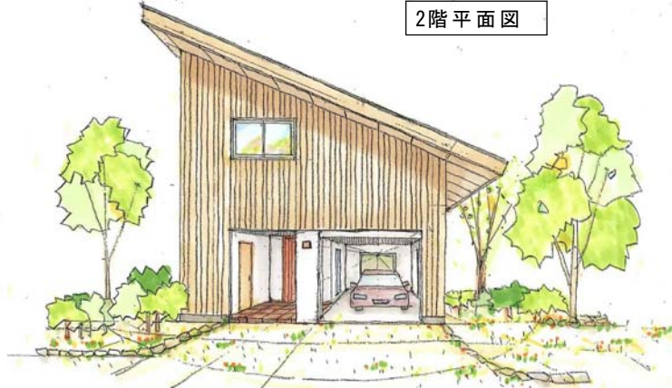
道路側外観スケッチ