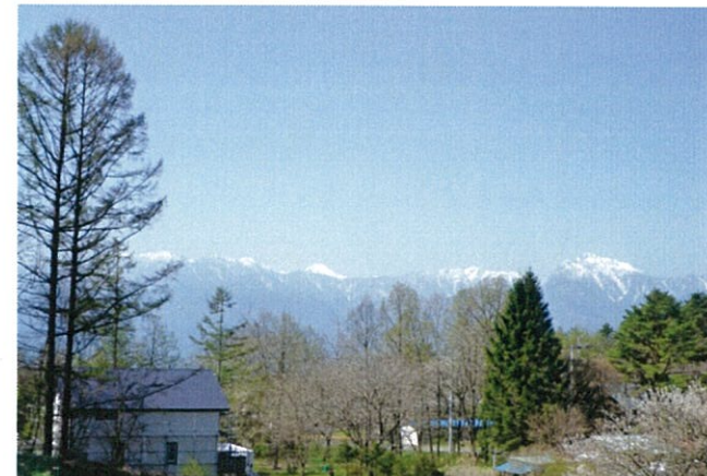
南アルプス・ハケ岳を望む。