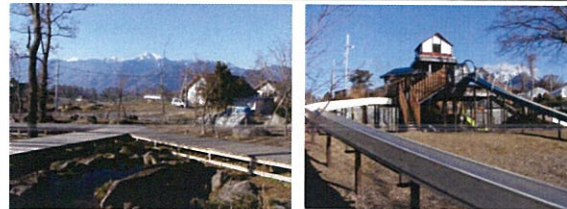
三分一湧水まで徒歩 15分