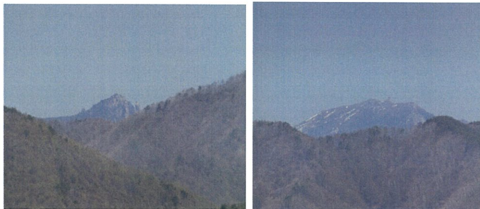
瑞牆山、金峰山を望む