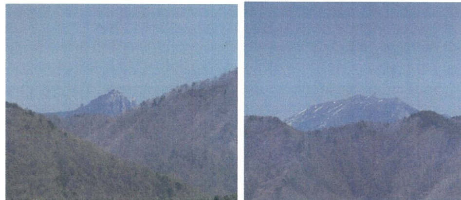
瑞牆山、金峰山を望む